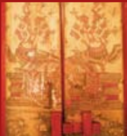
วัดเกรียงไกรกลาง