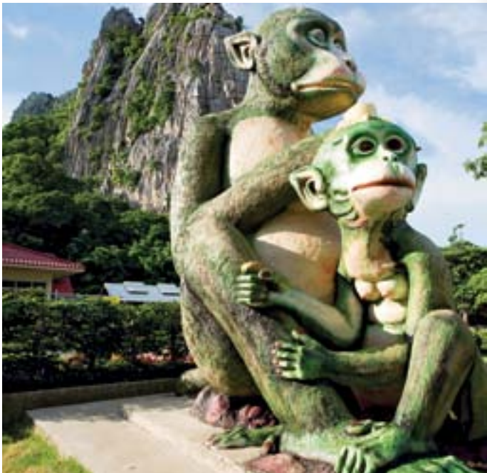
เขาน้อย - เขากแก้ว

ตลาดน้ำวัดบางประมุง อยู่ริมฝั่งคลองบางประมุง บริเวณด้านหลังวัด บางประมุง ชาวบ้านจะพายเรือนำสินค้าและผลิตผลทางการเกษตรในพื้นที่มาจำหน่ายทุกวันเสาร์-อาทิตย์ ระหว่างเวลา ๐๗.๐๐-๑๖.๐๐ น. นอกจากนี้ยังมีบริการอื่นๆ อีก อาทิ นวดแผนโบราณ การล่องเรือชมคลองบางประมุง ชมสวนกล้วย บริการเรือพาย จักรยานน้ำ สอบถามรายละเอียดได้ที่ ฝ่ายปกครอง ที่ว่าการอำเภอโกรกพระ โทร. ๐ ๕๖๒๙ ๑๐๐๖