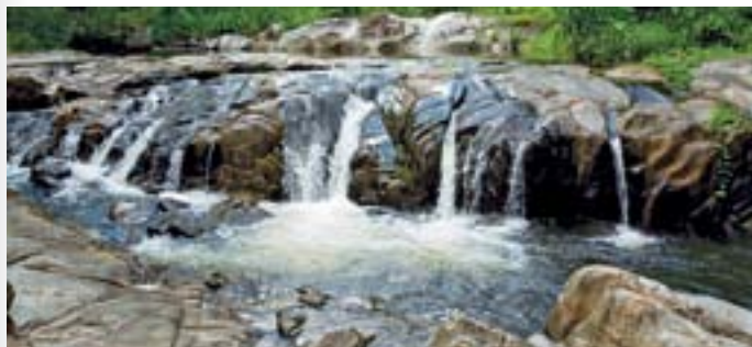
แก่งผานางคอย อุทยานแห่งชาติแม่วังก

การเดินทาง ห่างจากอำเภอแม่เป็นประมาณ ๘ กิโลเมตร ใช้เส้นทางสายลาดยาว-แม่เป็น จากนั้นแยกขวาทางไปวัดแม่กะสี อยู่ห่างจากตัว