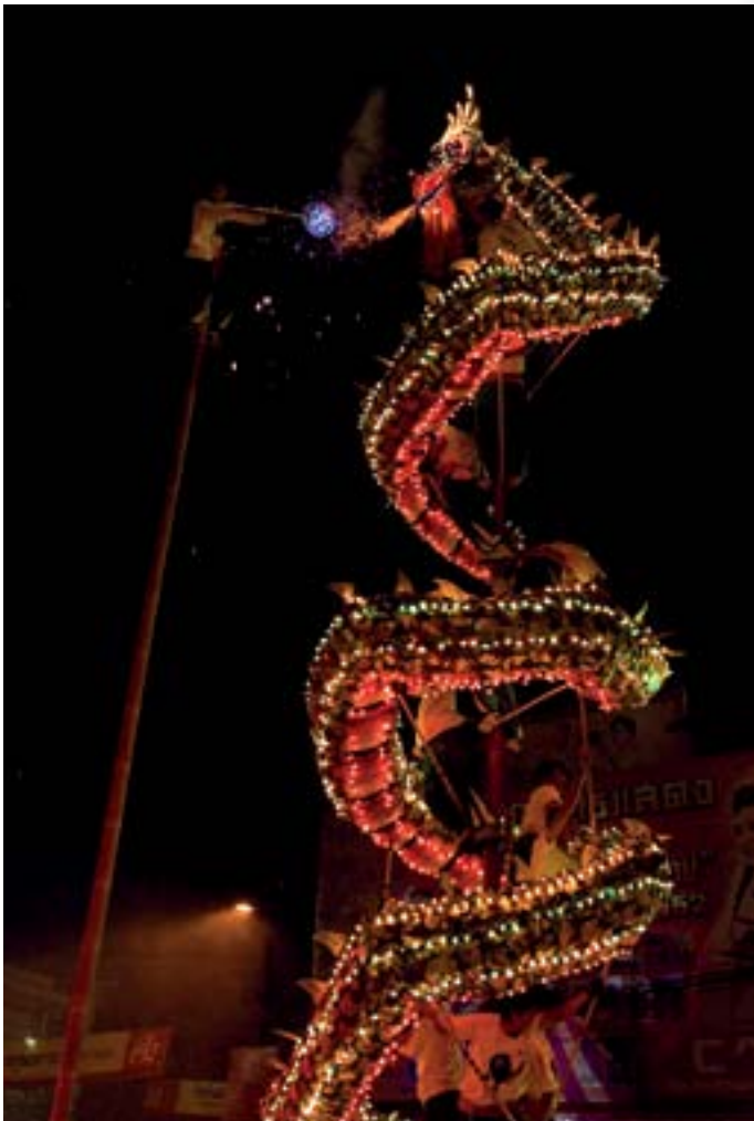
งานแห่เจ้าพ่อ-เจ้าแม่ปากน้ำโพ