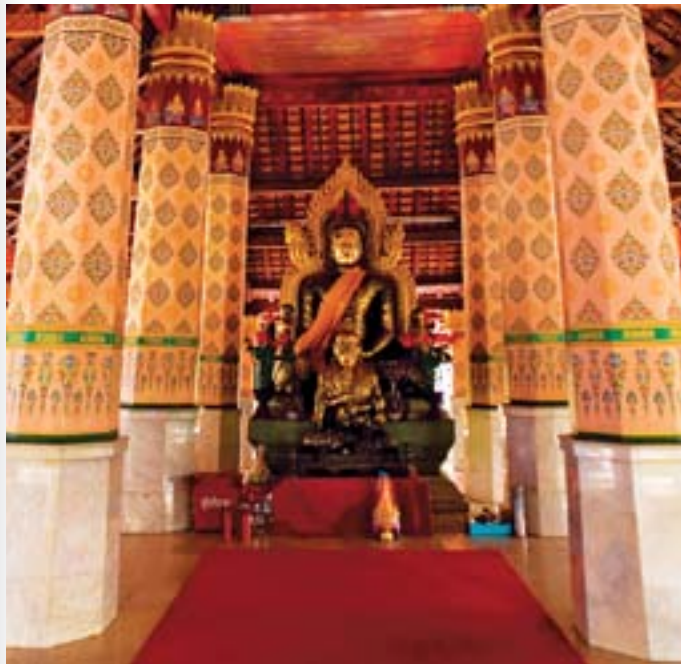
วัดจอมคีรีนาคพรต

อุทยานสวรรค์ เป็นสวนสาธารณะขนาดใหญ่อยู่ในเขตเทศบาลนครสวรรค์ มีผู้นิยมไปพักผ่อนหย่อนใจกันมาก มีเนื้อที่ ๓๑๔ ไร่ ใกล้เคียงแยกสายเชียงใหม่-พิษณุโลก ติดกับถนนสายเอเชีย อุทยานสวรรค์เดิมเป็น หนองน้ำขนาดใหญ่ เรียกว่า “หนองสมบุญ” มีดินนวงแหวน ๒ ชั้น ล้อมรอบตรงกลางเป็นเกาะมีเนื้อที่ ๔ ไร่ มีสวนหย่อม สนามหญ้า น้ำพุ เวทีกลางแจ้ง น้ำตก รมิฝั่งน้ำภายในอุทยานจัดเป็นสวนสุขภาพ ด้านหน้า ของสวนสาธารณะสร้างอย่างสวยงาม มีห้องน้ำ ห้องแต่งตัวบริการแก่ นักท่องเที่ยว