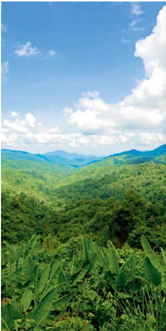
อุทยานแห่งชาติแม่วงก์