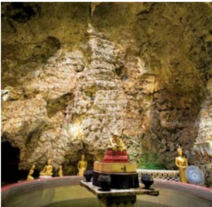
วัดถ้ำเพชรสวรรค์

ทางรถไฟ สายเหนือ กรุงเทพฯ-เชียงใหม่ ลงที่สถานีอำเภอตากาลี แล้วไปขึ้นรถโดยสารหรือรถรับจ้างไปถ้ำเพชร-ถ้ำทอง ประมาณ ๑๒