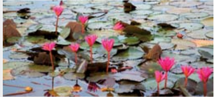
บึงบอระเพ็ด

บึงบอระเพ็ด เป็นบึงน้ำจืดขนาดใหญ่ที่สุดในประเทศไทย มีเนื้อที่ประมาณ ๑๓๒,๗๓๗ ไร่ ครอบคลุมพื้นที่ ๓ อำเภอ ได้แก่ อำเภอเมืองนครสวรรค์ อำเภอท่าตะโก และอำเภอชุมแสง ในอดีตบึงบอระเพ็ดได้ชื่อว่าเป็น “ทะเลเหนือ” หรือ “จอมบึง” เพราะมีสัตว์และพันธุ์พืชน้ำอยู่มากมาย จากการสำรวจพบว่า มีสัตว์อาศัยอยู่ประมาณ ๑๔๔ ชนิด พืช ๔๔ ชนิด เคยพบสัตว์หายากที่นี่ ได้แก่ นกเจ้าฟ้าหญิงสิรินธร ปลาเสือตอ ในเดือนพฤศจิกายนถึงมีนาคมจะมีนกเป็ดน้ำจำนวนมากอพยพมาที่บึงแห่งนี้ มีนกประจำถิ่นหลายชนิด อาทิ นกเป็ดน้ำ อีโก้ อีแจว ปากห่างซึ่งจะวาง