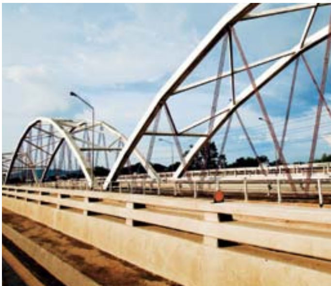
สะพานเดชาติวงศ์

บ้านลูกหมู ๗๒ หมู่ ๑๐ ถนนมาตุลี ไทร. ๐ ๕๖๓๗ ๒๓๗๓-๖ ไทรสาร ๐ ๕๖๓๗ ๒๓๗๗ จำนวน ๔๕ ห้อง ราคา ๓๕๐-๓๙๐ บาท