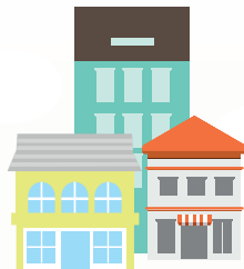
ครัวเรือน