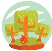
การเผาในที่โล่ง