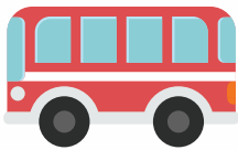
การจราจร